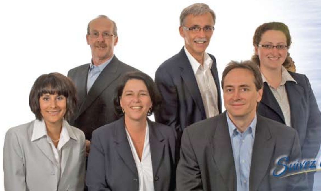
Le Comité organisateur du Congrès 2008 de l'AAP